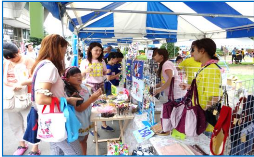
千曲市ふれあい広場で 自主製品の販売