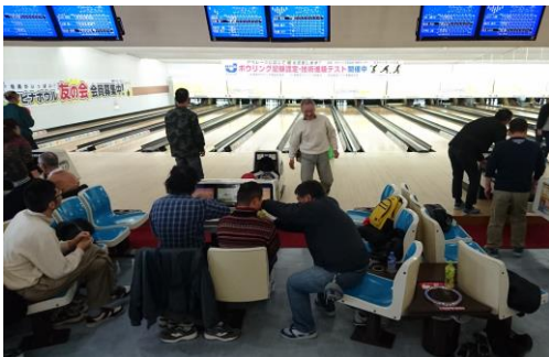
みんなでボウリング♪

休みの日などは各自で外出したり、予定を合わせて全員でイベントに参加したり、外食をしたり、温泉に行ったりしています。