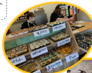
みんなで作った パーティメニュー♪ どの料理も美味しくて、 笑顔があらわれました！