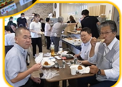
何度もお替わりしてお腹いっぱいです！