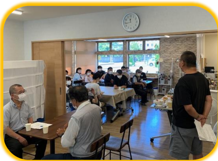
みんな緊張してるなあ 貸し切りの CoCo レスト 満席になりました！