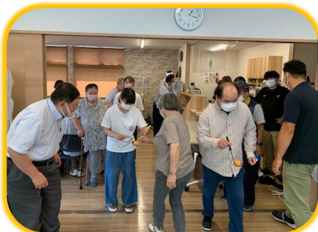
チームに分かれて対抗戦！ 最初の種目は、バトンの ピンポン玉を落とさずに チーム全員で繋がります！