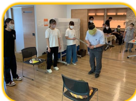
「一歩前だよ」 「少し左向いて」… チームメイトの声を 頼りにスイカ割り！